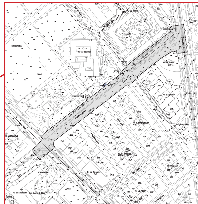
Ovan, ortofoto över utredningsområdets placering i Göteborg. Till höger, planområdet på ett koncept av plankartan, framtagen av SBK och daterad 2020-10-30.