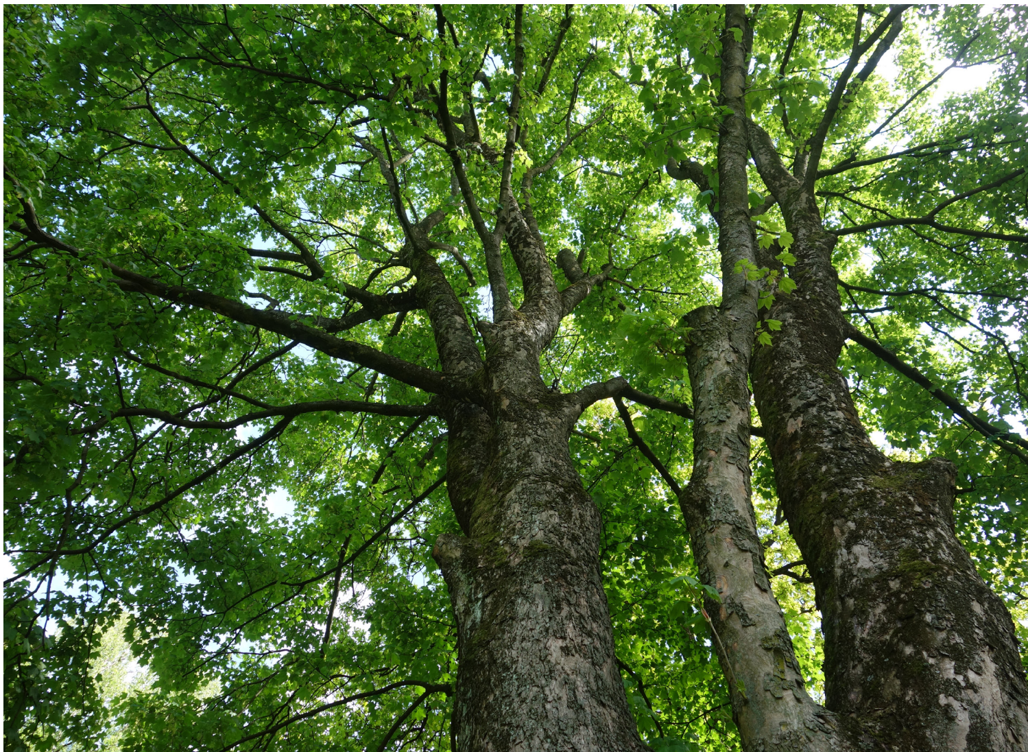
Äldre träd i parken intill Engelbrektskatan. Parken anlades på 1910-talet, troligen inför Jubileumsutställningen 1923.